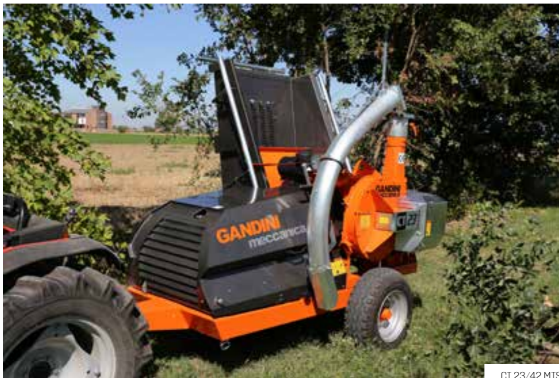
CT 23/42 MTS