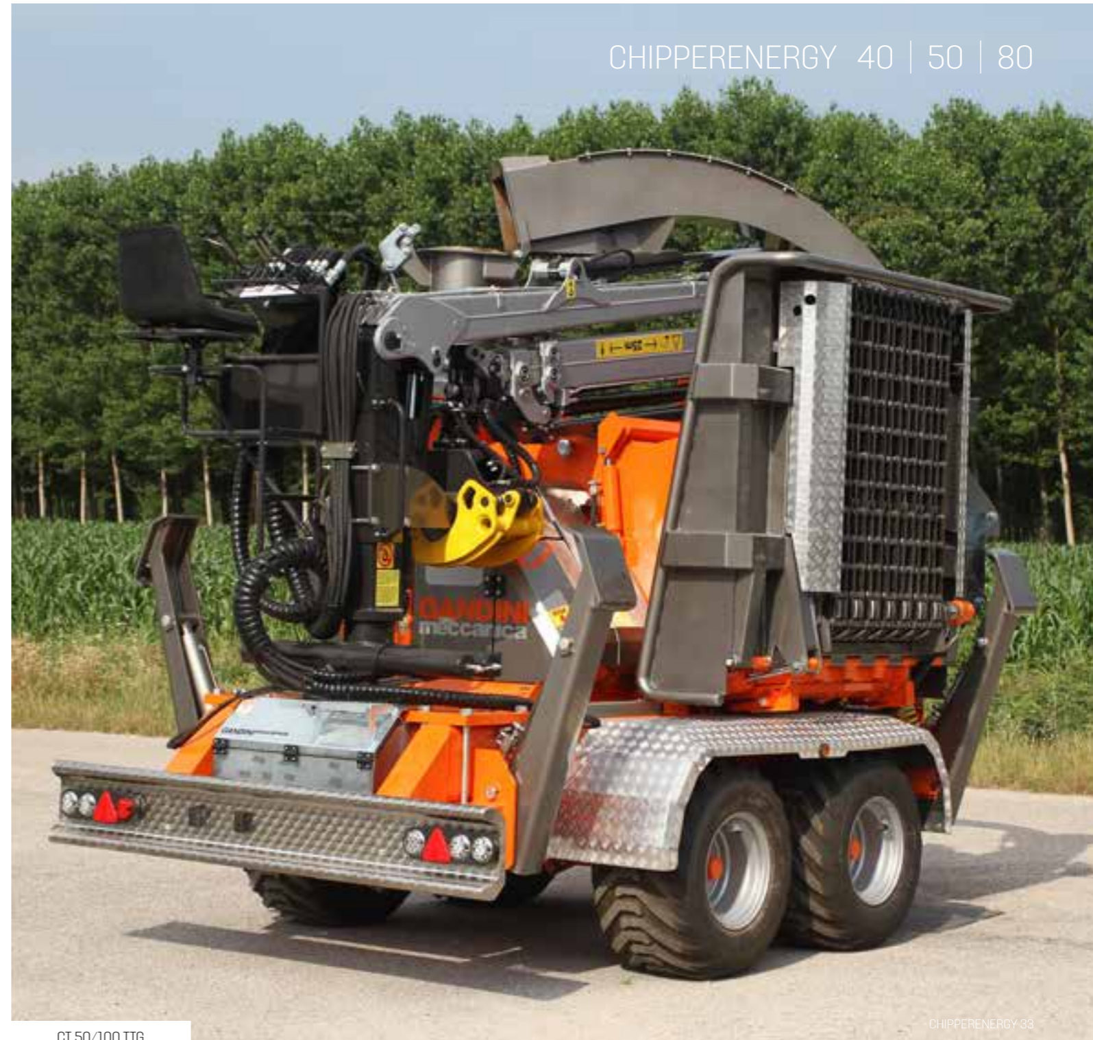
CT 50/100 TTG