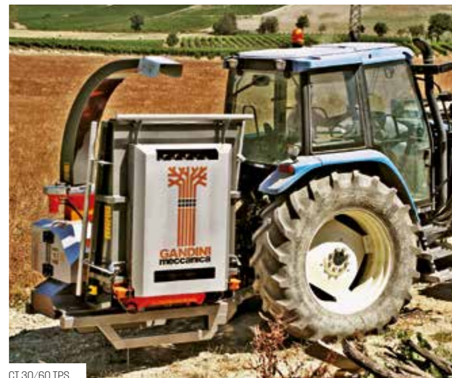
CT 30/60 TPS