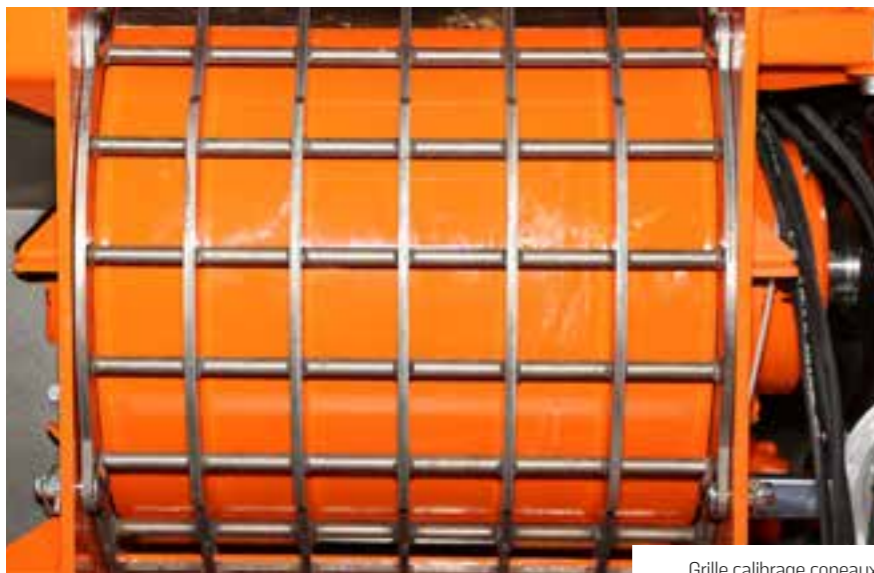
Grille calibrage copeaux