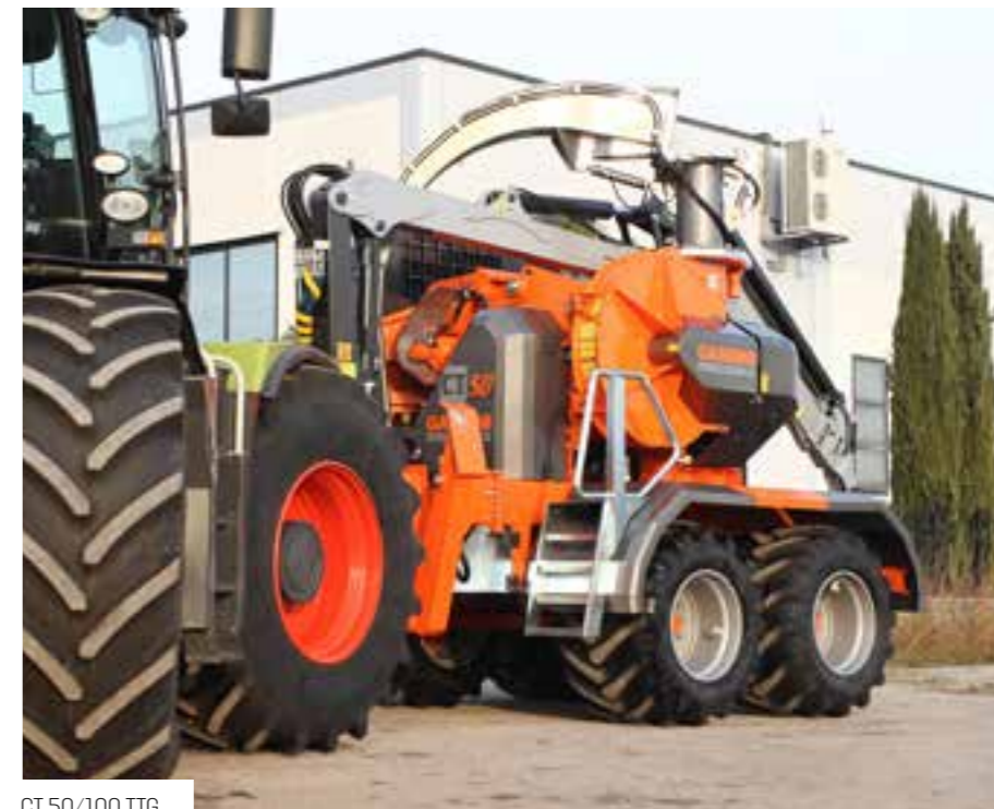
CT 50/100 TTG

L' installation hydraulique actionne toutes les opérations de la déchiqueteuse. Le circuit est composé de QUATRE pompes hydrauliques en fonte et de CINQ blocs d'électrovannes qui alimentent individuellement les trois rouleaux de traction dentés et les autres services dont la rotation du tube pour la sortie des copeaux, le mouvement du rouleau mobile, etc.