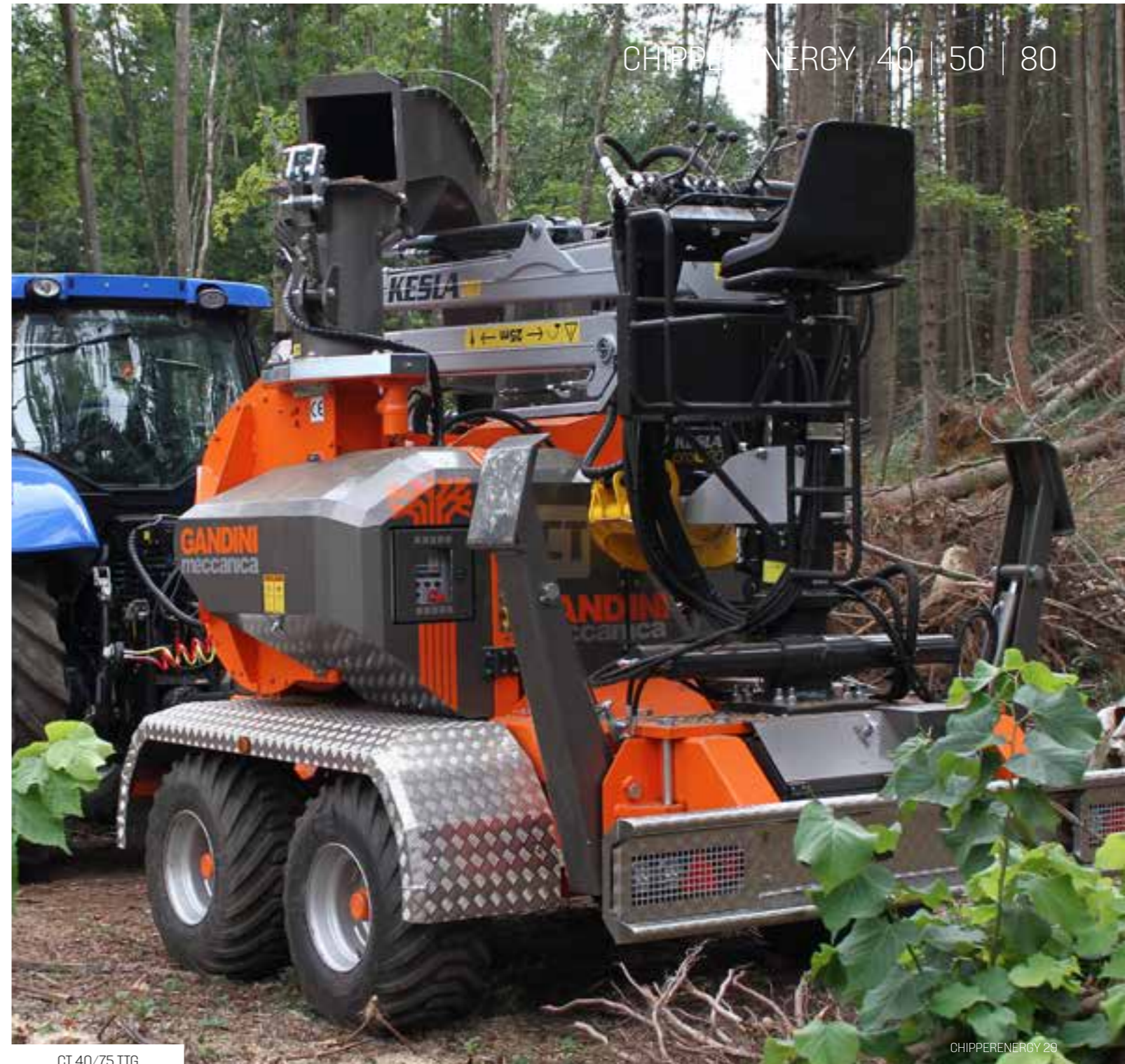
CT 40/75 TTG

Le tôles sujettes à une usure majeure , telles que la zone caisse à ventilateur, la zone tambour, la tôle externe du tuyau d'expulsion de copeaux, sont en acier HARDOX600 anti-usure. Le ventilateur de dégagement est composé de terminaux vissés interchangeables.