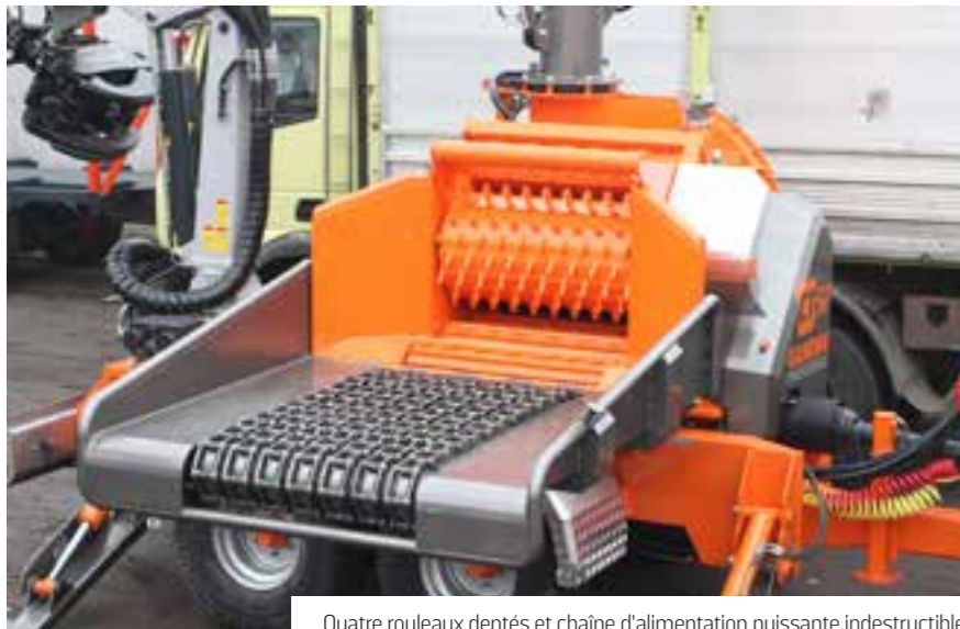
Quatre rouleaux dentés et chaîne d'alimentation puissante indestructible