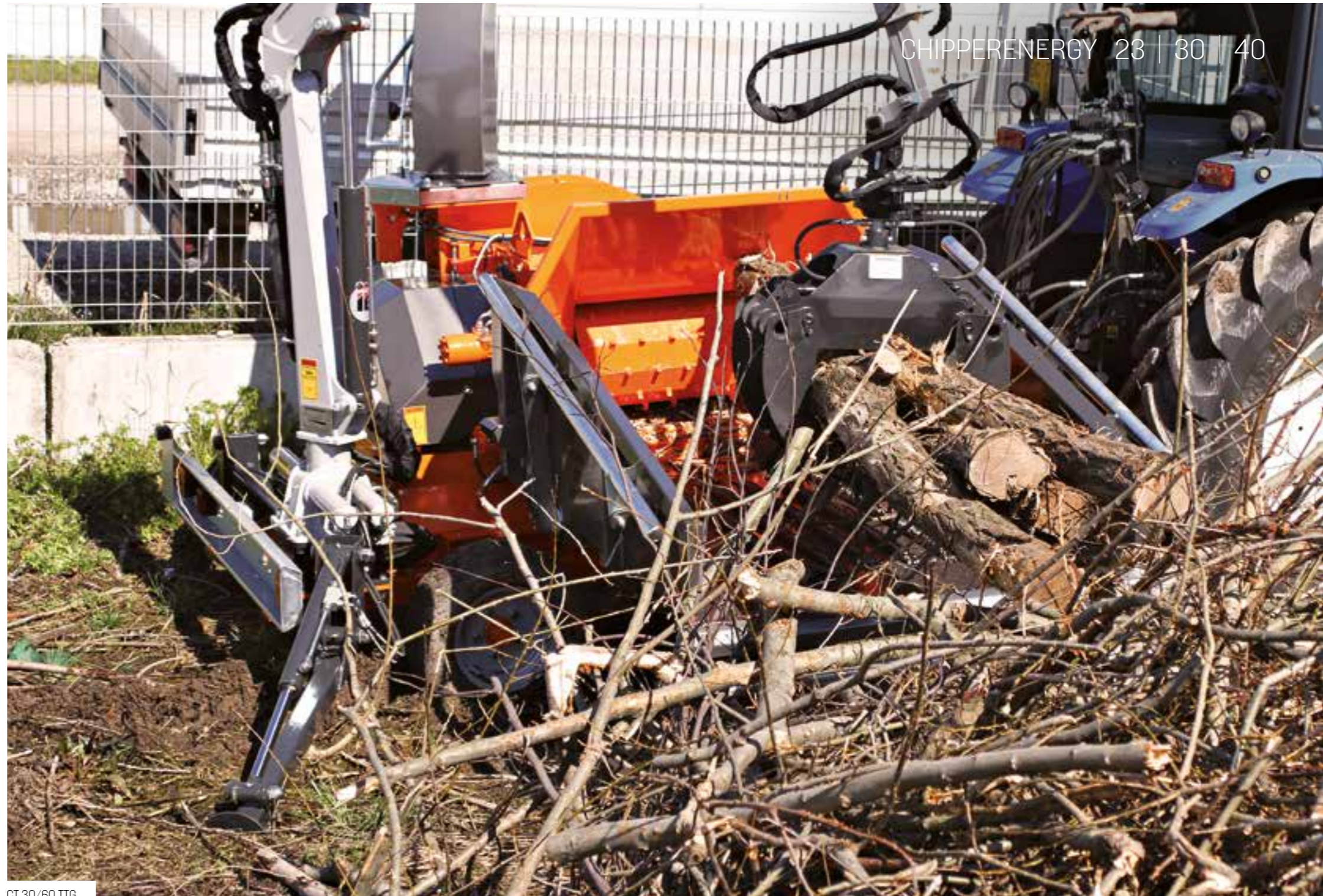
CT 30/60 TT6