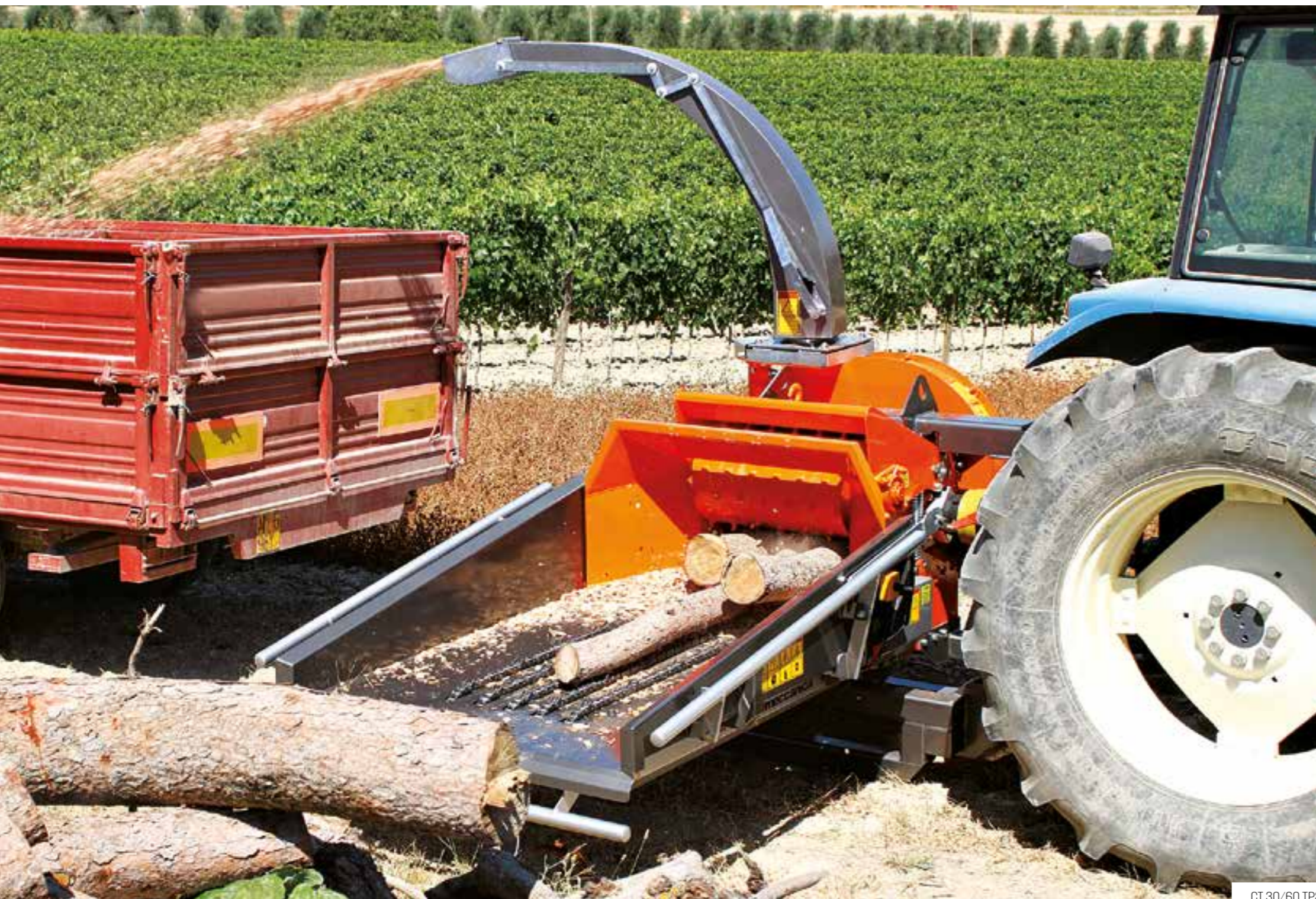
CT 30/60 TPS