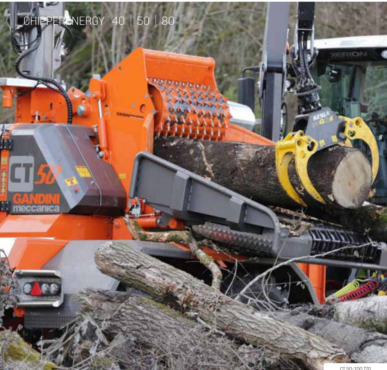
CT 50/100 TTG

Les rouleaux dentés tracteurs horizontaux (trois plus 4 supplémentaires en option) sont actionnés par des motoréducteurs épicycloïdaux surdimensionnés à bain d'huile. Cela garantit une grande force de traction, permettant de traiter de grandes quantités de matériau, des troncs de grand diamètre ou avec bifurcations, branchages, etc.