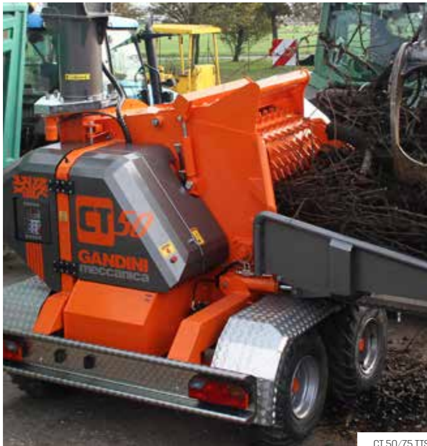
CT 50/75 TTS

La vanne de dégagement copeaux , à effet aspirant, est placée en contact direct avec le tambour déchiqueteur. Cela permet que les copeaux soit immédiatement extraits après leur déchiquetage, permettant une considérable réduction de la puissance absorbée et de la poussière. L'absence d'organes à l'intérieur, comme les vis horizontales, permet de maintenir la vitesse des copeaux. Cela permet au ventilateur de tourner moins vite, diminuant ainsi l'usure des lames de glissement. La simplicité du système d'expulsion élimine complètement tout problème d'obstruction même pour le broyage des branches vertes avec des feuilles.