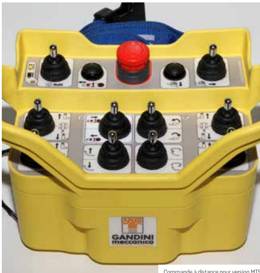
Commande à distance pour version MTS