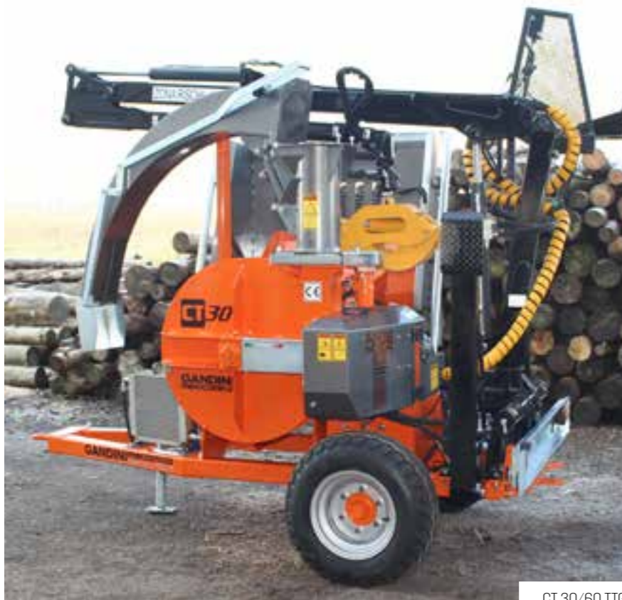
CT 30/60 TT6