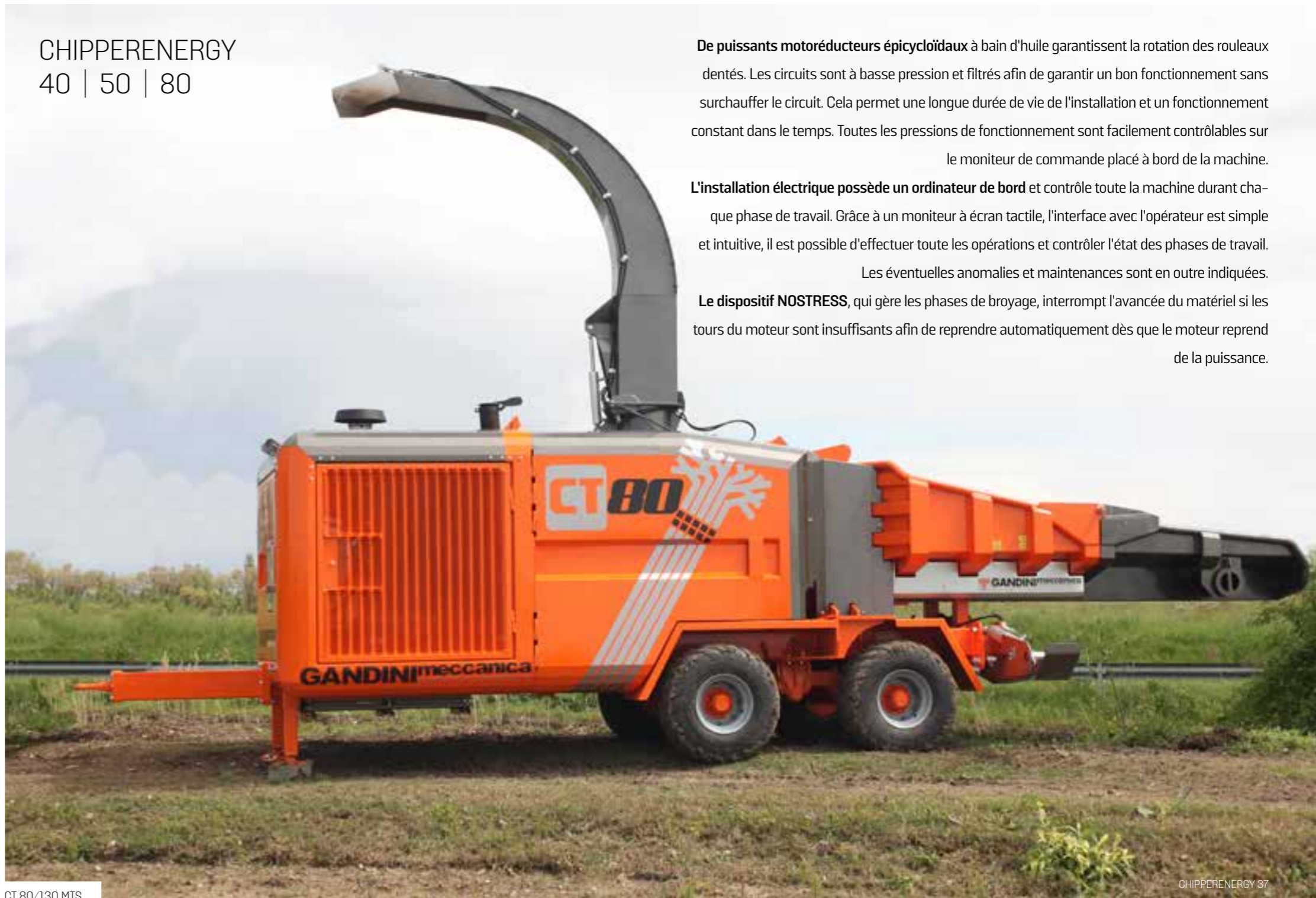
CT 80/130 MTS

De puissants motoréducteurs épicycloïdaux à bain d'huile garantissent la rotation des rouleaux dentés. Les circuits sont à basse pression et filtrés afin de garantir un bon fonctionnement sans surchauffer le circuit. Cela permet une longue durée de vie de l'installation et un fonctionnement constant dans le temps. Toutes les pressions de fonctionnement sont facilement contrôlables sur le moniteur de commande placé à bord de la machine.