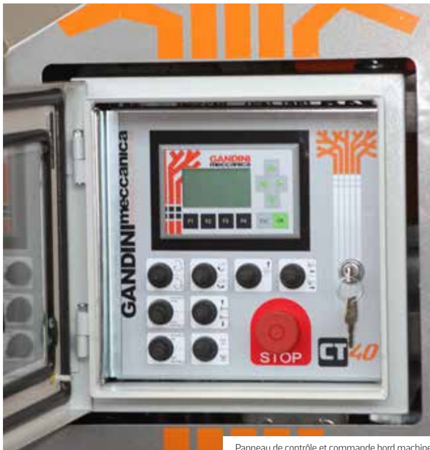
Panneau de contrôle et commande bord machine

Pour stimuler la production de copeaux et exploiter au mieux la puissance développée, ces déchiqueteuses sont équipées d'une série de rouleaux dentés à grande capacité de préhension, auxquels il est possible d'ajouter une chaîne industrielle pour permettre de convoyeur à l'intérieur de la déchiqueteuse des quantités considérables de rameaux de moyennes et grandes dimensions. Tous les modèles sont également équipés d'une grille de calibrage à la sortie, pour fournir des copeaux de tailles différentes.