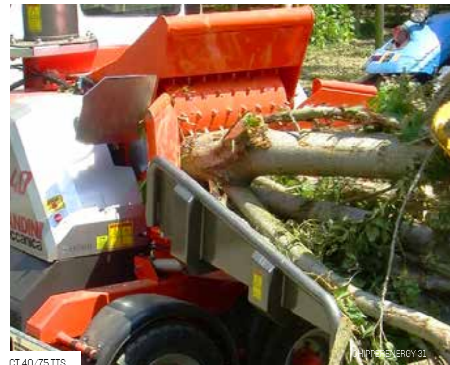
CT 40/75 TTS