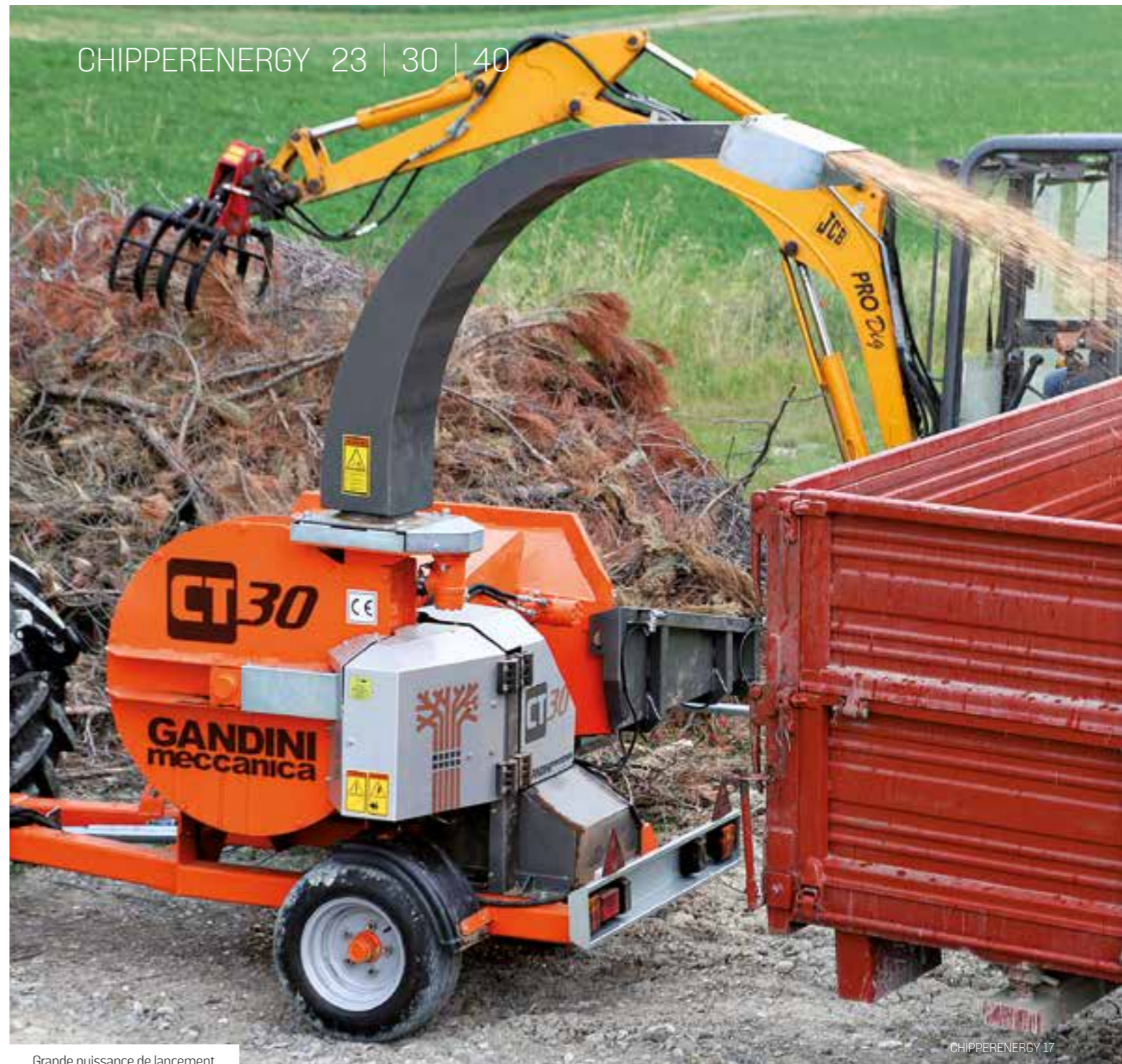
Grande puissance de lancement