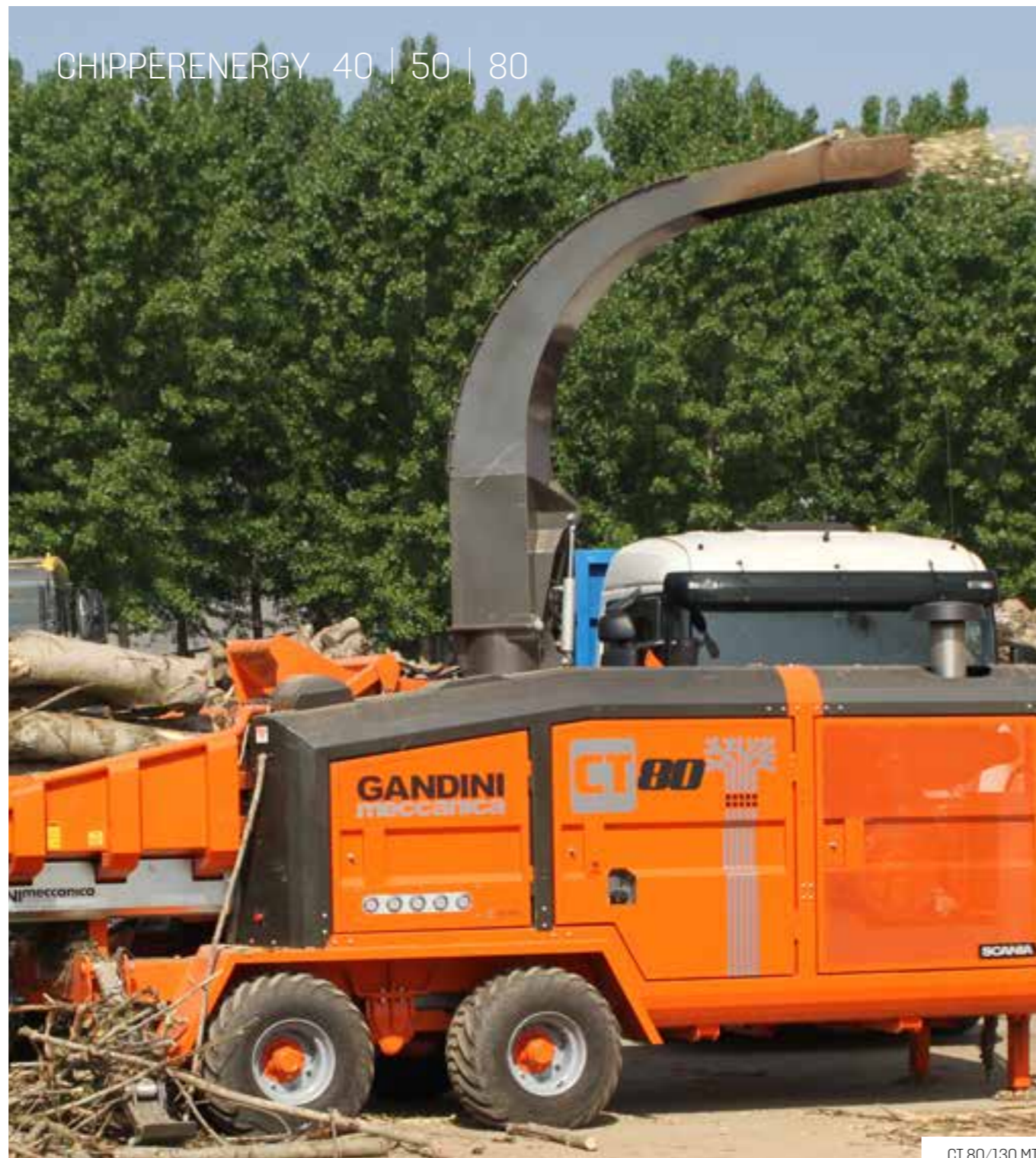
CT 80/130 MTS