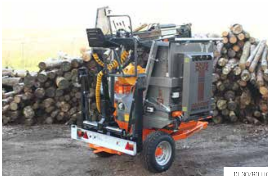
CT 30/60 TT6