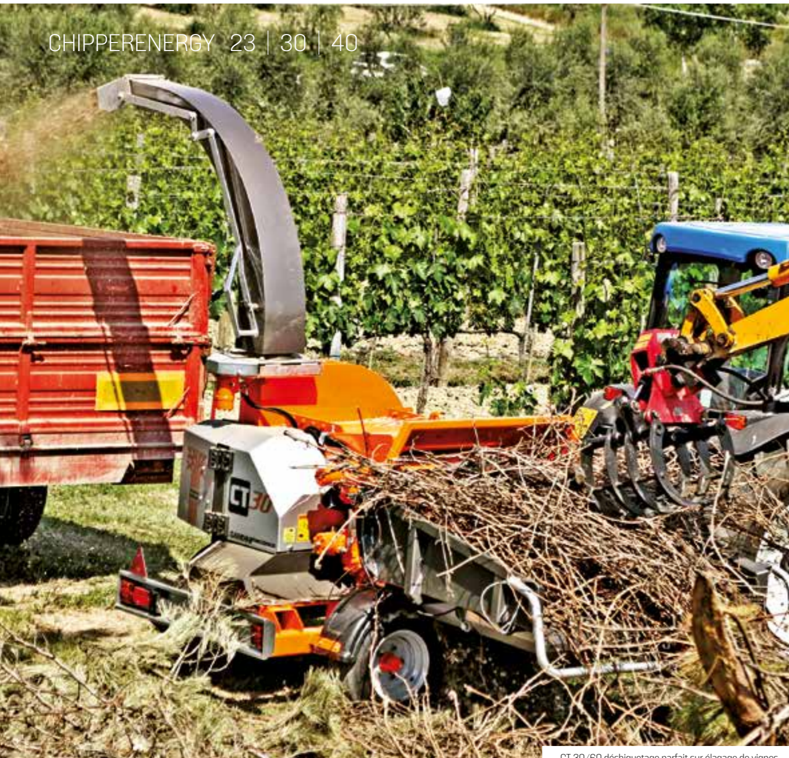
CT 30/60 déchetage parfait sur élagage de vignes