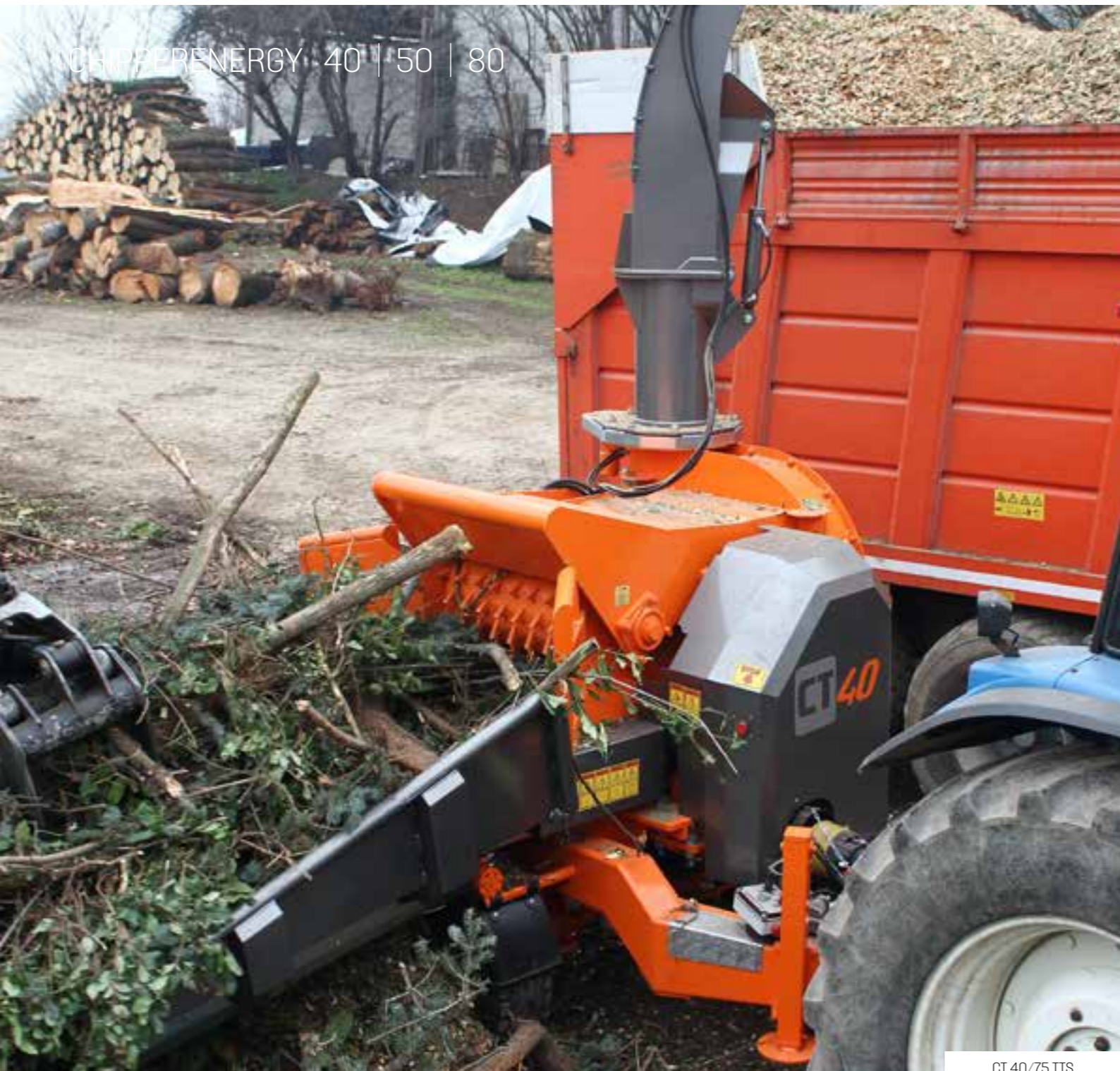
CT 40/75 TTS

Le tambour déchiqueteur de grand diamètre travaille au mieux les troncs même de grosses dimensions. Il est composé de deux rangées de 5 lames, facilement remplaçables pour les opérations d'affûtage. La lame est fixée au tambour avec des vis en acier. Les vis le fixent dans des douilles filetées et cimentées interchangeables, placées sur le plan d'appui des lames.