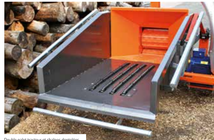
Double galet tracteur et chaînes dentelées

Les solutions techniques innovantes appliquées permettent d'utiliser la ligne Energy pour les travaux particulièrement lourds et continus, qui peuvent inclure les chantiers forestiers, le déchiquetage des résidus des scieries et l'entretien des grands parcs. Il est possible de broyer tout type de matériau ligneux, qu'il s'agisse de troncs, branches, rameaux, feuillages, résidus de rognage et écimage, même de résineux et de palmiers et de bois particulièrement dur. Système innovant d'extraction des copeaux : ceux-ci sont extraits instantanément du tambour de broyage par un système de dépression qui permet d'éliminer tous les organes intermédiaires tels que les vis sans fin et autres dispositifs. Ceci permet de réduire la puissance absorbée, de limiter la présence de poussière dans les copeaux, de prolonger la durée de vie des lames, de réduire les coûts d'entretien et d'éliminer tout problème d'engorgement de la déchiqueteuse. Élimination des engorgements : il est possible de broyer parfaitement des matériaux verts et humides, sans aucun problème d'engorgement.