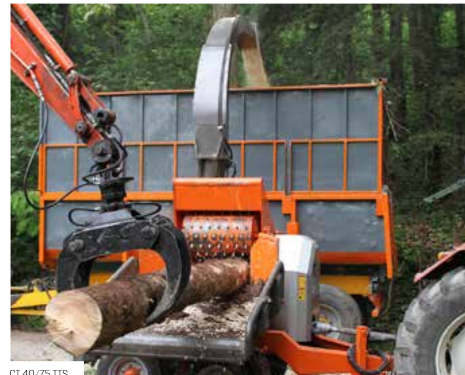
CT 40/75 TTS

Les roulements du tambour déchiqueteur sont de type à double tour de roulements à tonnelets et surdimensionnés, contenus dans des supports en acier travaillés en plein avec commande numérique par ordinateur (cnc) avec une grande bride d'appui pour garantir une forte stabilité.