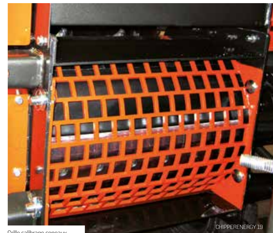
Grille calibrage copeaux