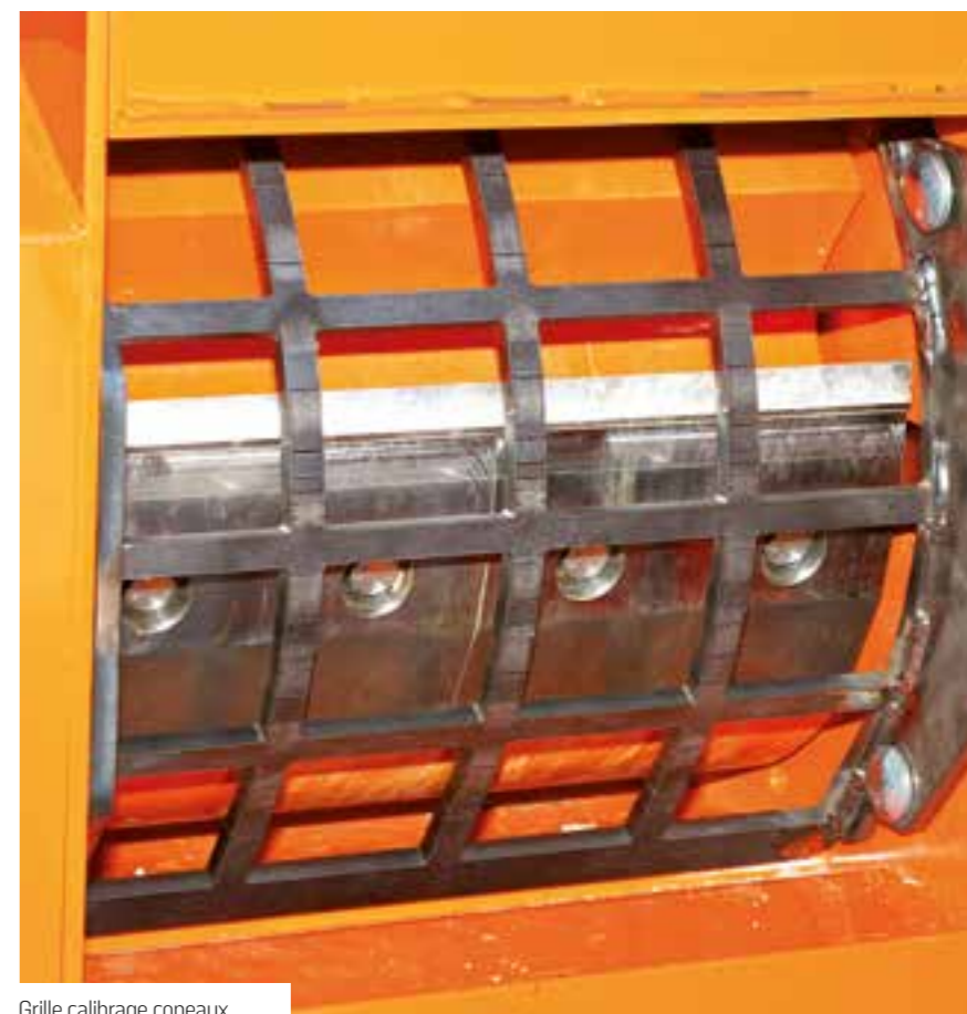
Grille calibrage copeaux