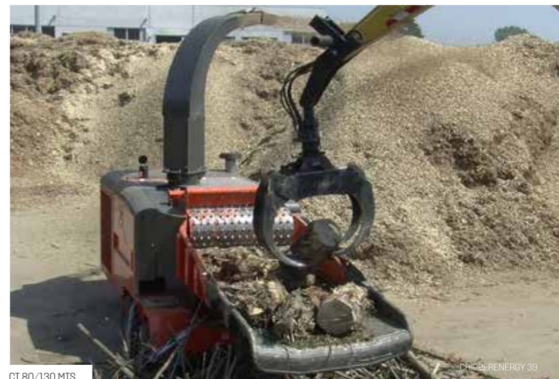
CT 80/130 MTS