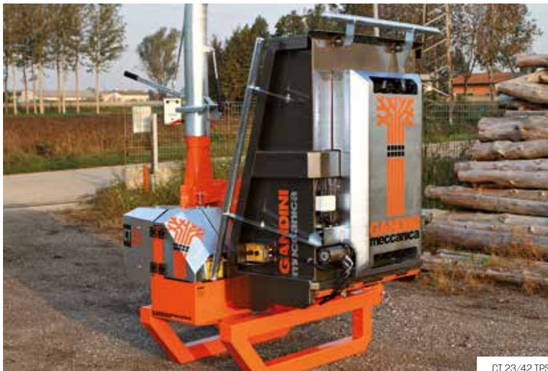
CT 23/42 TPS