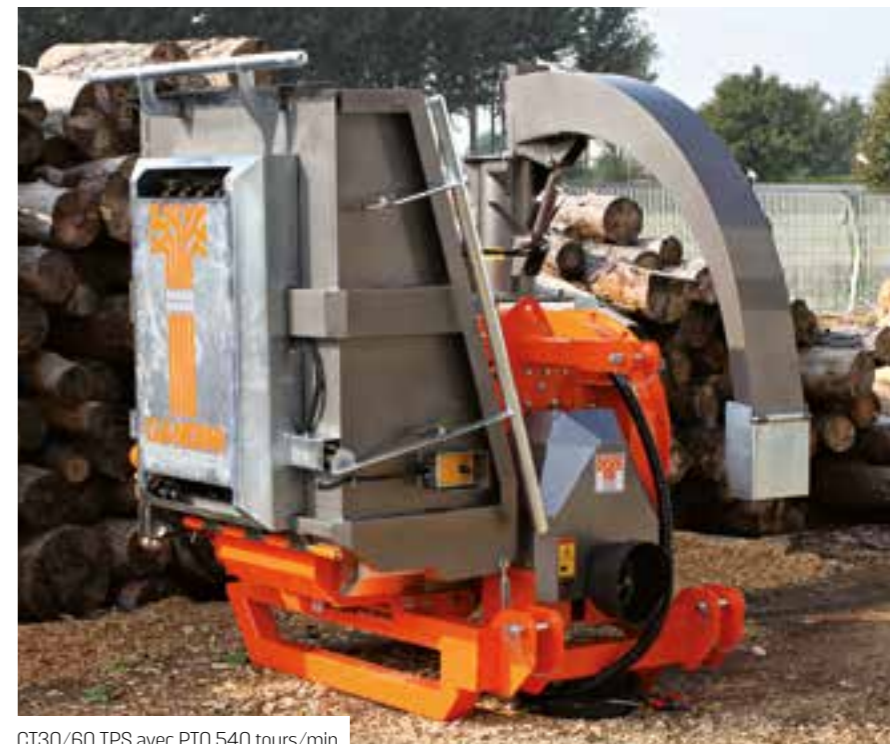
CT30/60 TPS avec PTO 540 tours/min