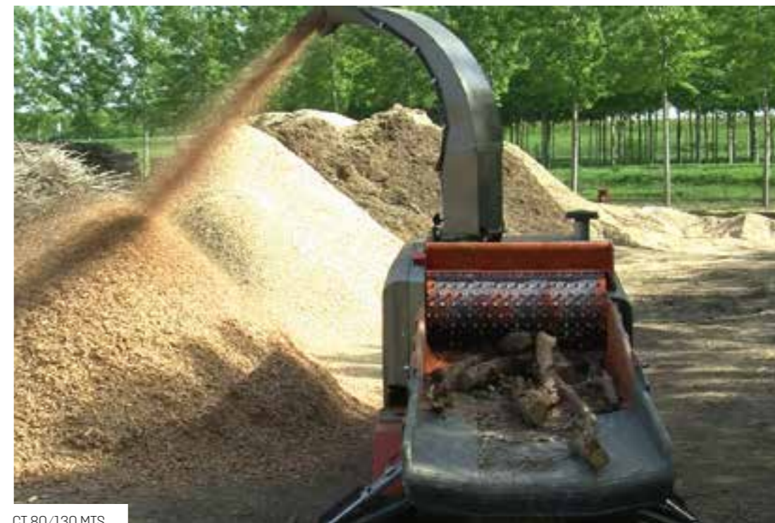
CT 80/130 MTS