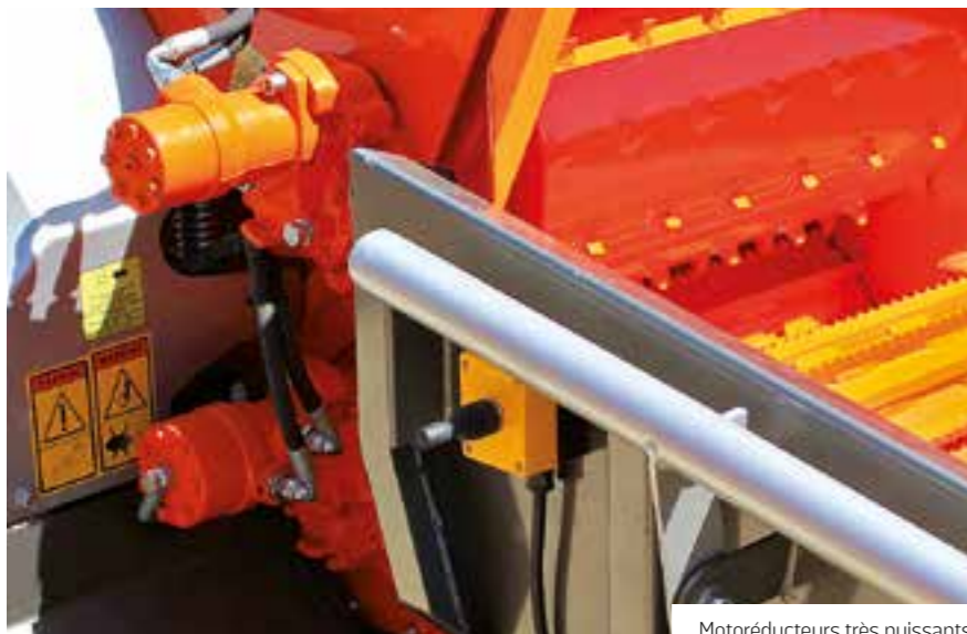
Motoréducteurs très puissants