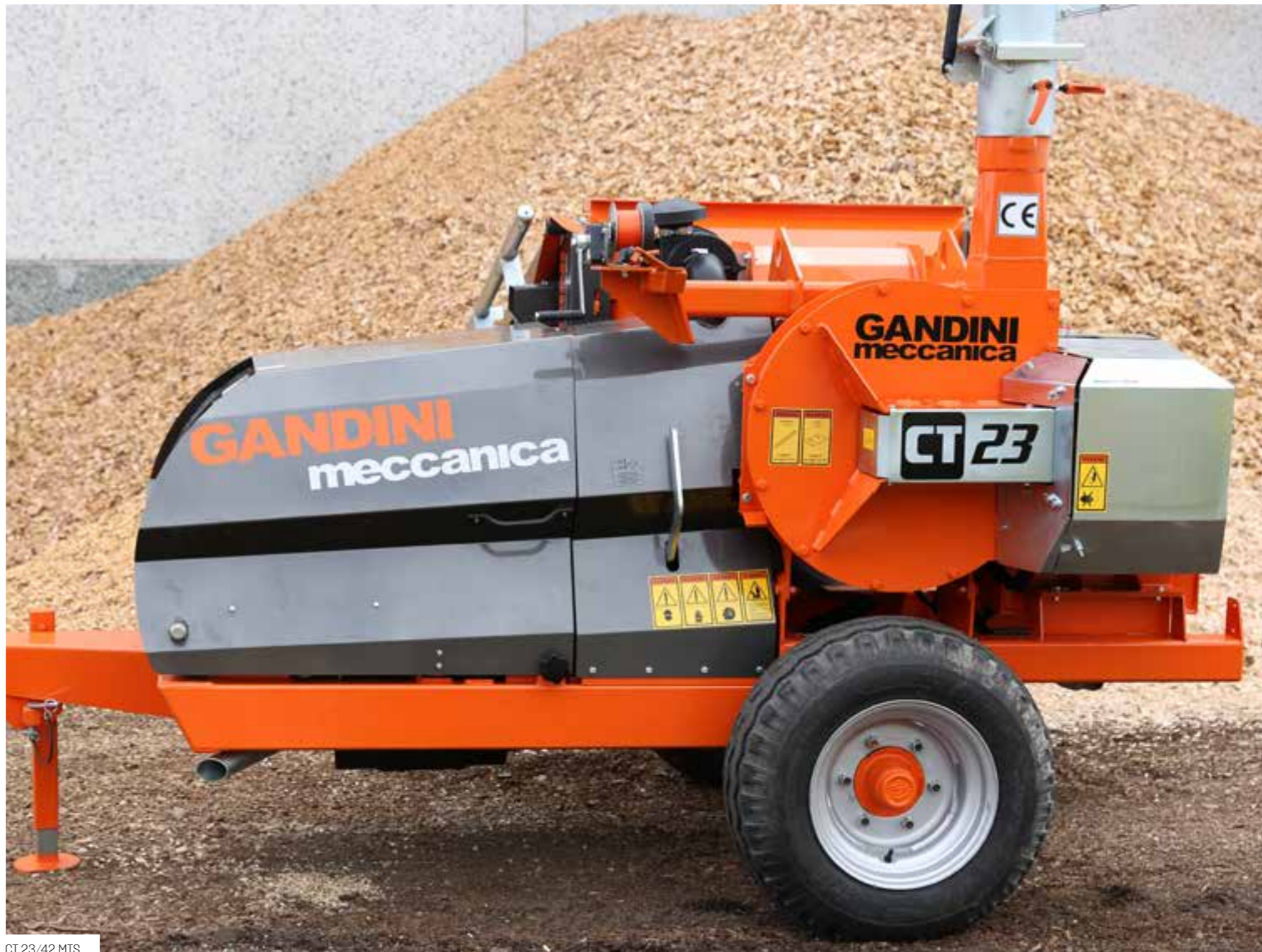
CT 23/42 MTS