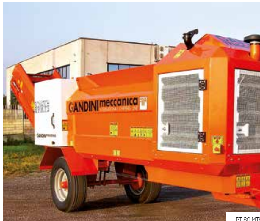
BT 89 MTS