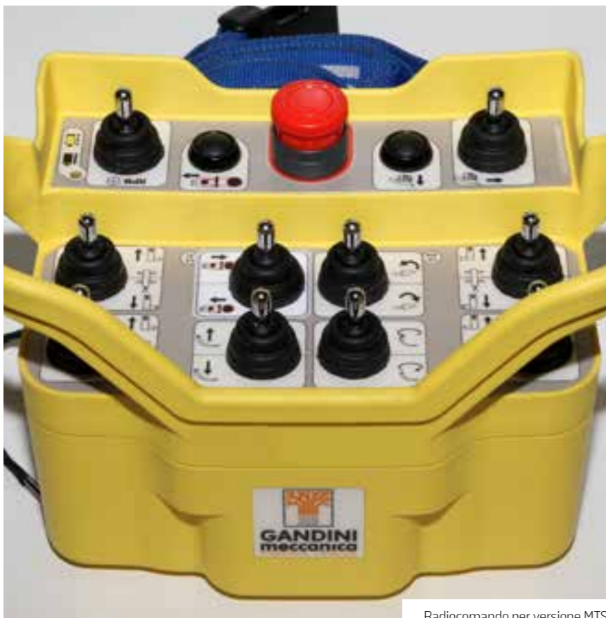
Radiocomando per versione MTS