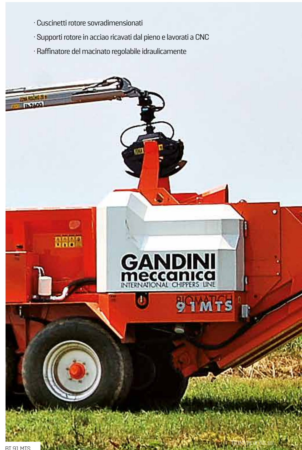
BT 91 MTS