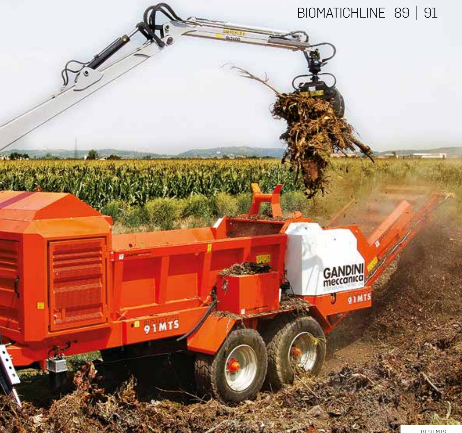
BT 91 MTS

Il dispositivo NOSTRESS, che gestisce la fase di macinatura, interrompe l'avanzamento del materiale quanto il motore scende troppo di giri, per riprendere automaticamente non appena il motore ha riacquisito potenza.