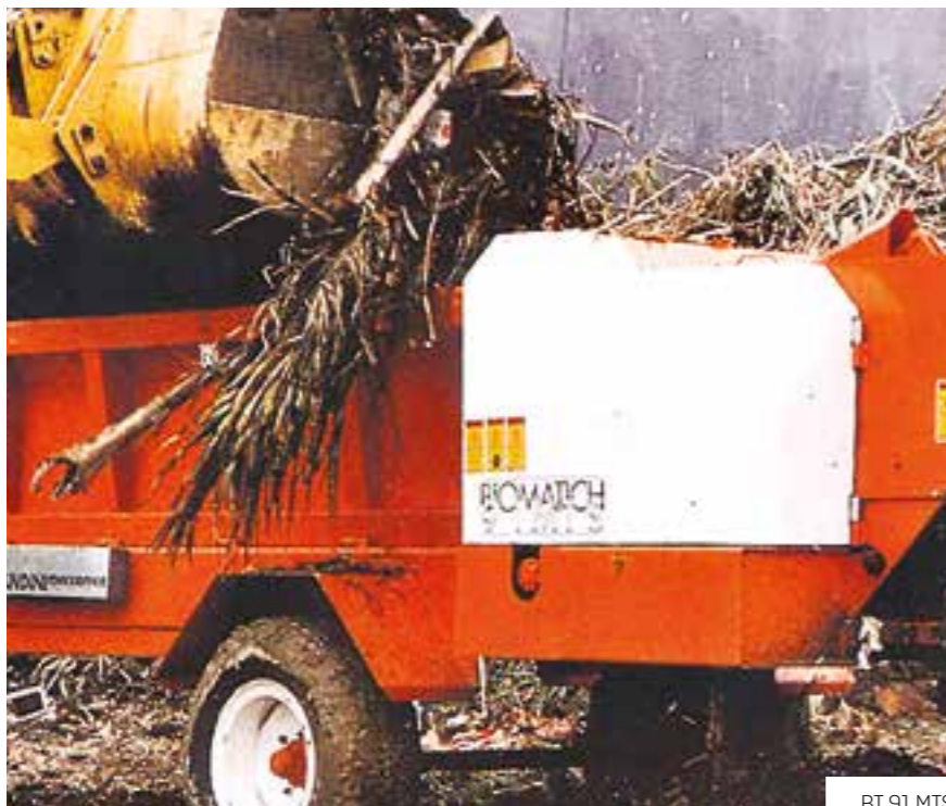
BT 91 MTS

La grande tramoggia di carico rende facile l'inserimento del materiale da tritare con qualsiasi mezzo, può essere alimentata da pala gommata, o caricatore con pinza forestale, polipo, caricatore telescopico, ecc.