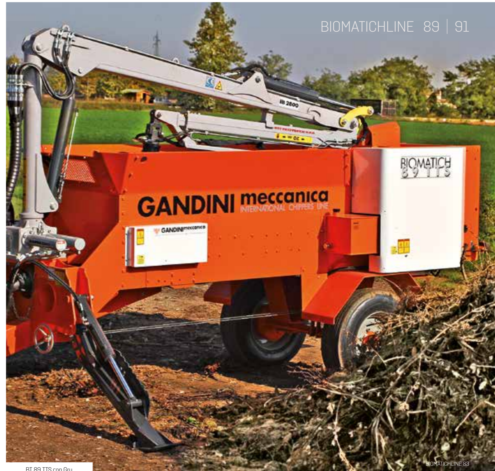
BT 89 TTS con Gru

Grazie alla struttura molto robusta, la linea BIOMATICH è particolarmente indicata per lavori gravosi e continuativi. Disponibile in vari allestimenti, azionata da presa di forza del trattore, con motore autonomo, posta su semovenza cingolata e su camion scarrabile, per postazione fissa con motore elettrico. Il rotore di triturazione è realizzato con lamiere di acciaio antiusura ad alto spessore, la particolare struttura a nido d'ape ne conferisce rigidità e durata nel tempo, resistendo anche a forti urti. Composto da martelli in acciaio altamente legati, sono forgiati a caldo per avere la massima tenacità, montati su un perno in acciaio che ne consente la rotazione, così da potersi retrarre in caso di forti urti ed evitare il danneggiamento. La combinazione tra acciai speciali permette di non dover mai ingrassare i martelli, in quanto non si creano attriti e surriscaldamenti durante il lavoro. Il rotore di triturazione ruota su due cuscinetti speciali con doppio giro di rulli a botte e supporto in acciaio lavorato a cnc, particolarmente sovradimensionati, garantiscono una lunga durata anche in presenza di lavoro particolarmente gravoso. L'impianto idraulico, composto da elettrovalvole e tandem di pompe con flangia in ghisa ad alte prestazioni, aziona tutte le funzioni della macchina, alcune delle quali sono gestite direttamente e in modo automatico dai controlli elettronici posti a bordo macchina.