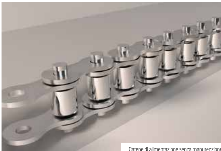
Catene di alimentazione senza manutenzione