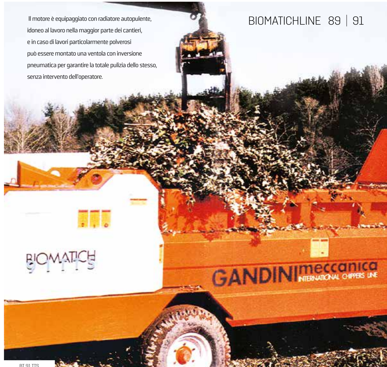
BT 91 TTS

Il motore è equipaggiato con radiatore autopulente, idoneo al lavoro nella maggior parte dei cantieri, e in caso di lavori particolarmente polverosi può essere montato una ventola con inversione pneumatica per garantire la totale pulizia dello stesso, senza intervento dell'operatore.