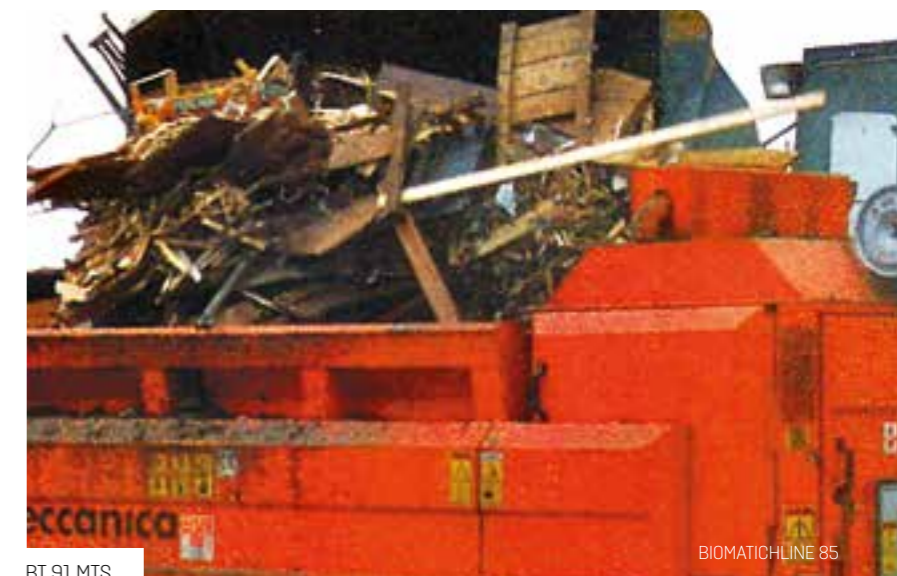
BT 91 MTS