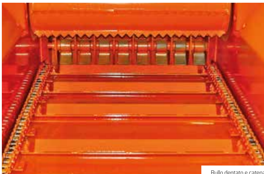
Rullo dentato e catena

La grande tramoggia di carico rende facile l'inserimento del materiale da tritare con qualsiasi mezzo: pala gommata, pinza forestale, polipo, caricatore telescopico, ecc. La linea BIOMATICH 89 e 91 produce materiale tritato disponendolo in cumuli di altezza regolabile in funzione delle esigenze specifiche di ulteriori lavorazioni. È in grado di tritare qualunque tipo di residuo vegetale, utilizzando il deflettore posteriore che funge da raffinatore con regolazione idraulica si e produce un materiale molto sfibrato di pezzatura regolabile adatto a qualunque tipologia di compost o utilizzo energetico.