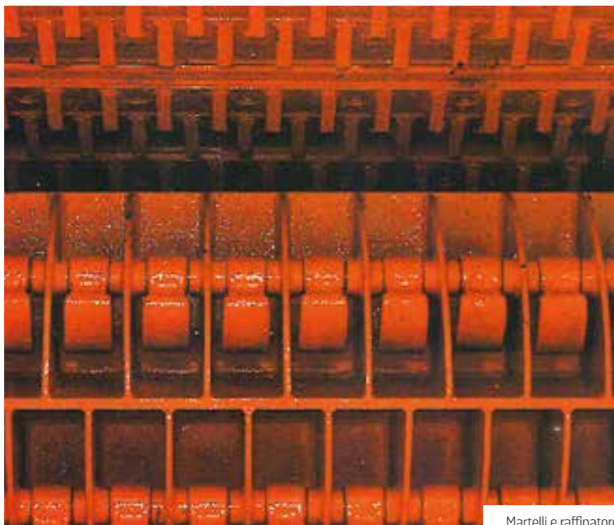
Martelli e raffinatore

BT 89-91 MTS: ogni versione MTS di questa serie di trituratori a martelli, è azionata da un motore diesel autonomo e può essere trainata da trattore o da camion. La geometria della macchina vede il motore posizionato nella parte anteriore, così da non essere direttamente a contatto con polvere o altri residui che ne potrebbe compromettere il funzionamento, rende altresì più accessibile lo stesso per le manutenzioni periodiche. La trasmissione del moto al rotore di macinatura è garantita da un giunto idraulico con inserimento automatico e da una batteria di cinghie trapezoidali con sezione maggiorata con tensionamento automatico.