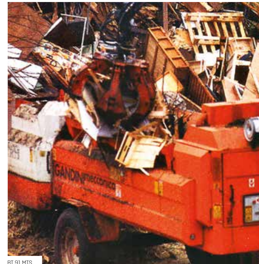
BT 91 MTS

Bt 89-91 tts: la versione tts di questa serie di trituratori a martelli, con assale rigido e ruote, è predisposta per essere azionata e trainata da ogni tipo di trattore con una potenza di almeno 80 hp.