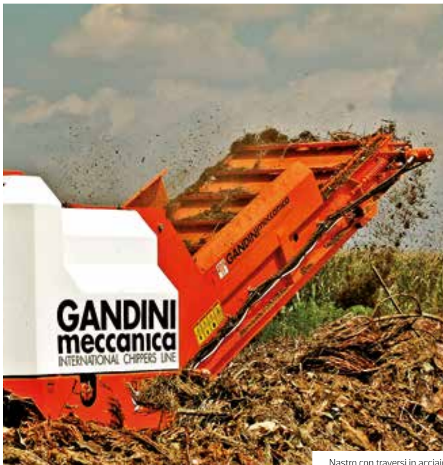
Nastro con traversi in acciaio